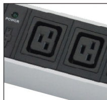
IEC320 C19 16AMP sockets