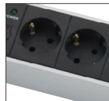
DIN49440 Schuko sockets**