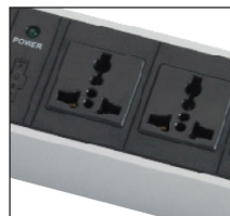
GB2099.3 universal sockets