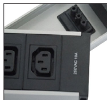
Snap in module design IEC320 C13 10AMP sockets shown