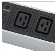
IEC320 C19 16AMP sockets